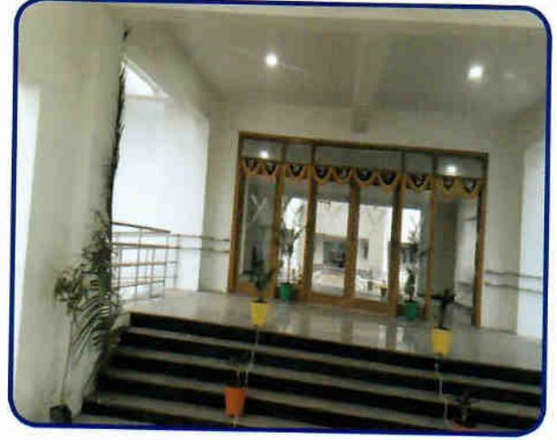
भासवि विशाखापत्तनम का नवीन परिसर