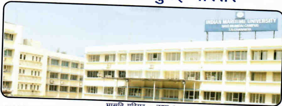
भासवि परिसर – दृश्य 1