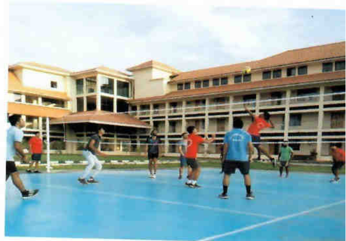
खेलने का क्षेत्र