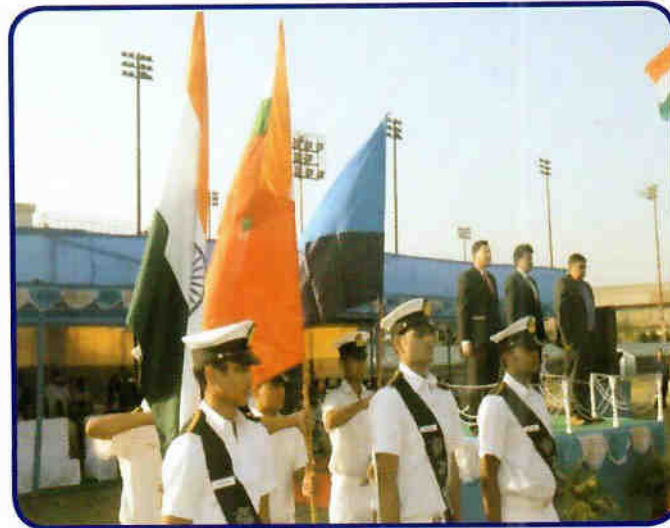
प्री-पासिंग आउट परेड – नवंबर 2018