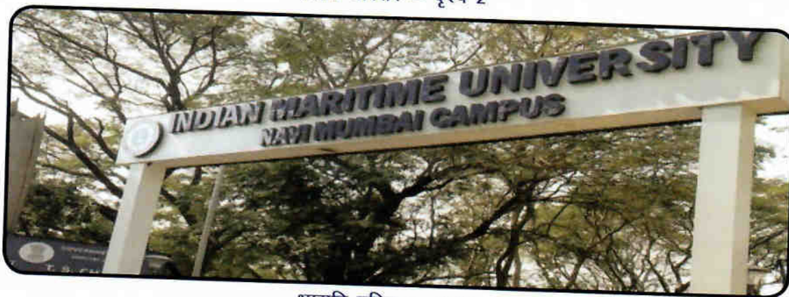
भासवि परिसर – दृश्य 3