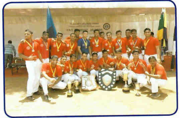
वार्षिक क्रीड़ा दिवस