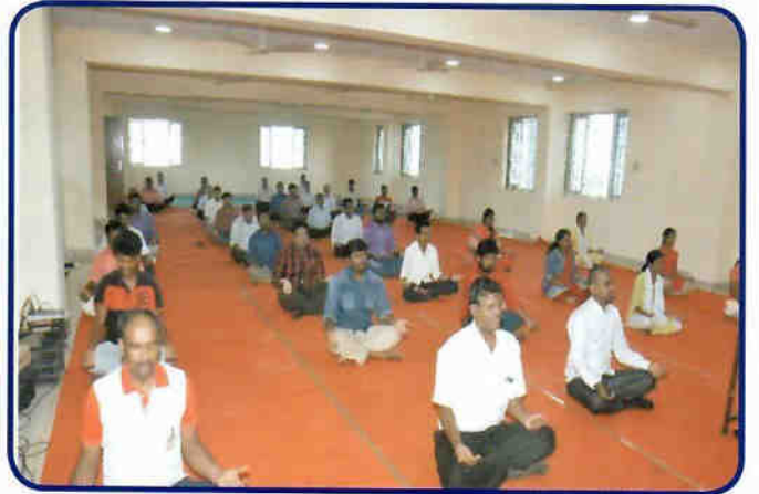
अंतरराष्ट्रीय योग दिवस भासवि-मुख्यालय में प्रगति पर