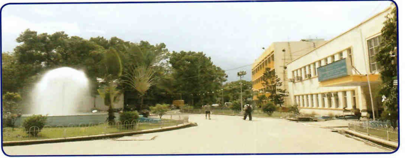
शैक्षिक-सह-प्रशासनिक भवन – सामने का दृश्य