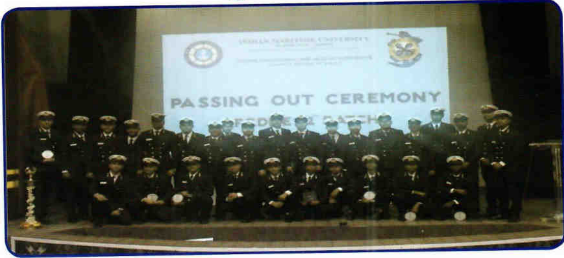
पासिंग आउट समारोह