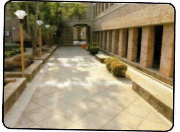
भासवि परिसर — दृश्य 2