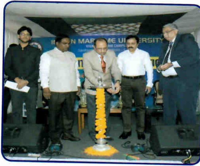
विश्वविद्यालय दिनोत्सव 14.11.2018 मुख्य अतिथि : निदेशक, भारतीय पेट्रोलियम ऊर्जा संस्थान, विशाखापत्तनम