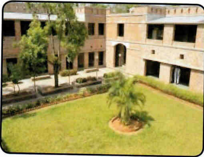
भासवि परिसर — दृश्य 3