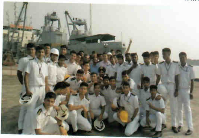
IMU कोच्चि कैम्पस के कैडेट