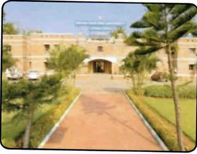
भासवि परिसर — दृश्य 1