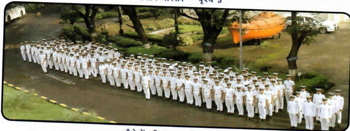
कैडेटों की प्रातःकालीन परेड