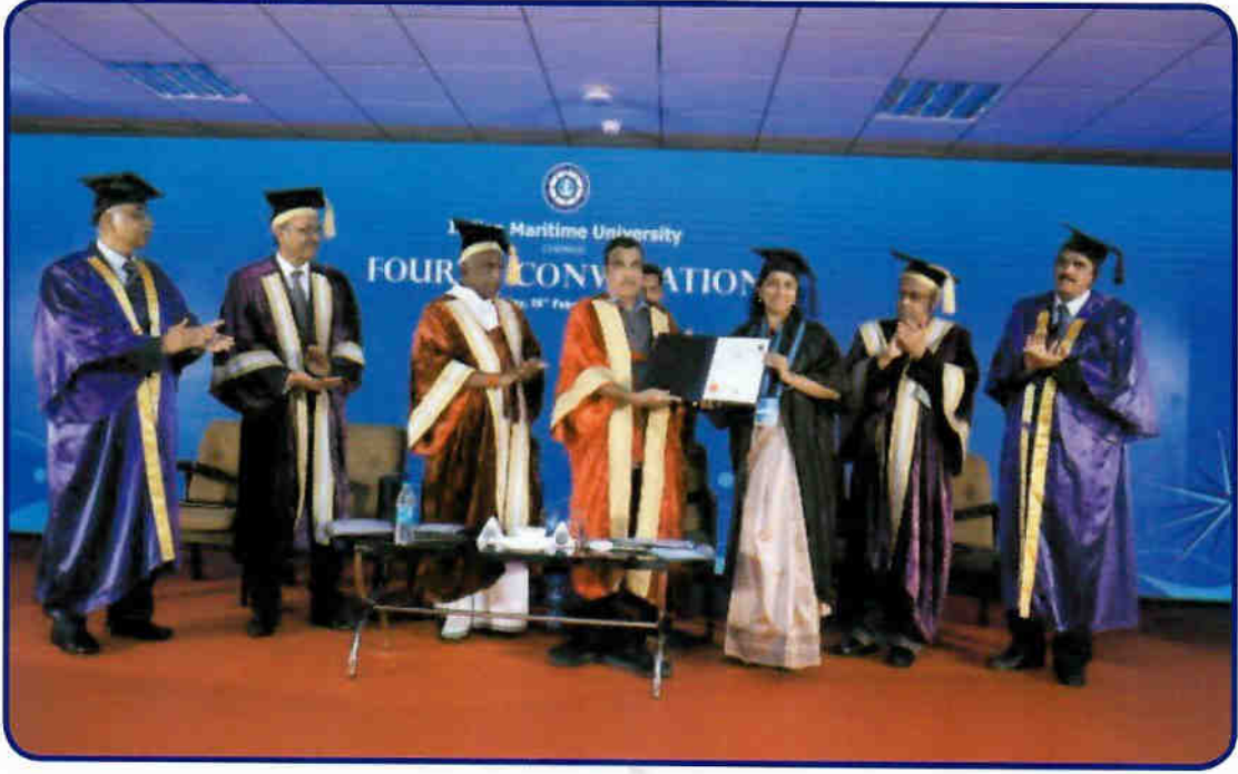
चतुर्थ दीक्षांत समारोह