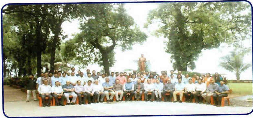
भासवि मुंबई पोर्ट परिसर के संकाय और कर्मचारी